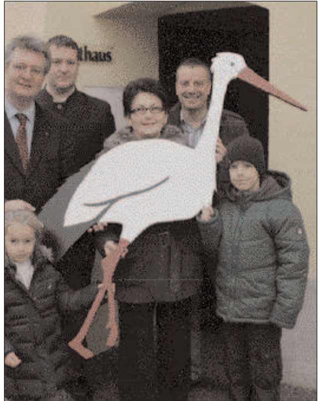
Die Pfaffstättner "Geburtenstörche" sind fertig und können am Gemeindeamt ausborgt werden!