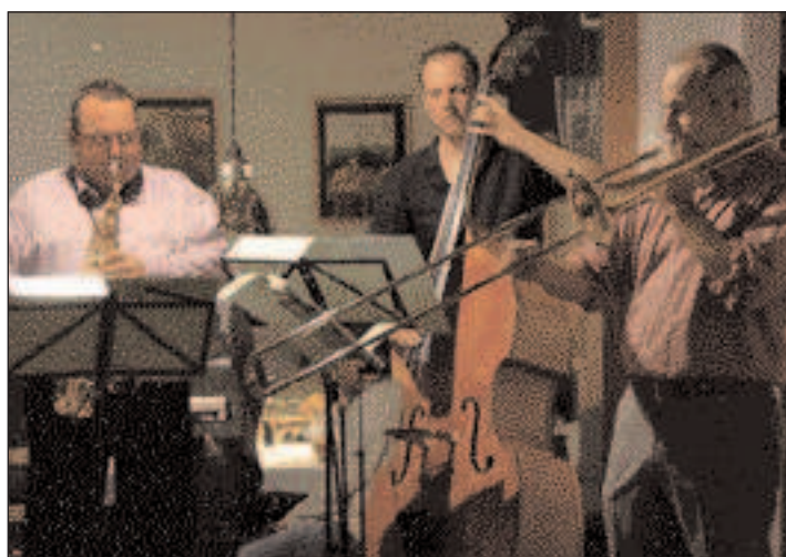
Musik.naturtrüb-Jazz-Soiree beim "Österreicher aus Pf."