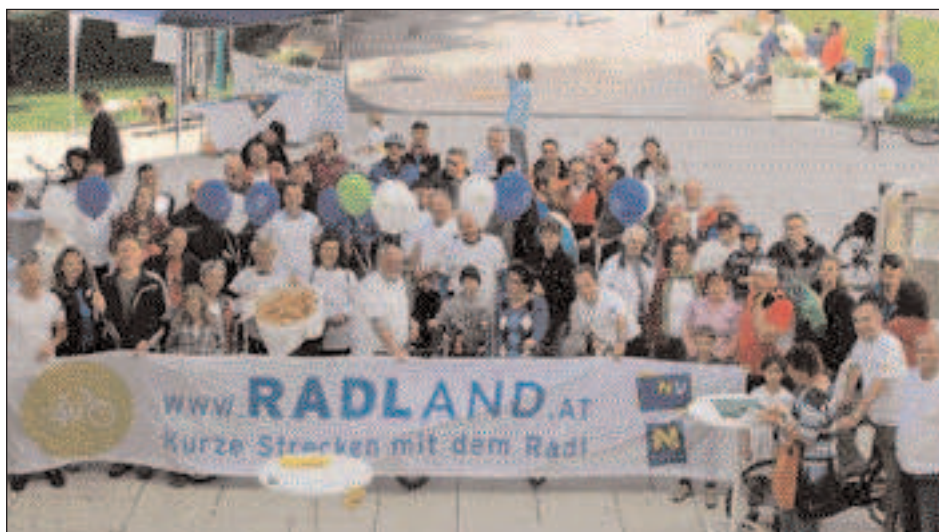
Pfaffstätten zählt zu den Gemeinden mit dem größten Anteil an Radfahrern