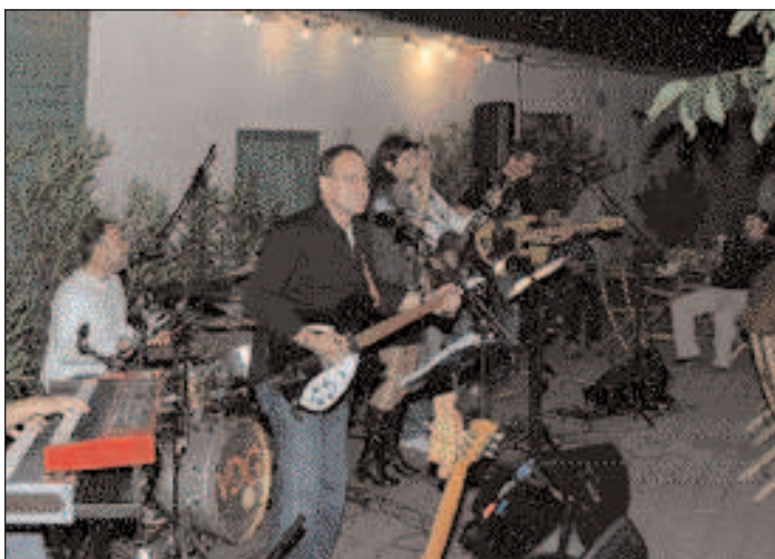
Songs der 60er und 70er beim "Steinbrunnenheurigen"