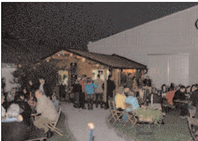
Reggae-Soul-Blues beim Radlheurigen